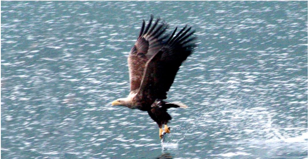
Merikotka kiittää pitkin merenpintaa kalasaalis kynsissään.